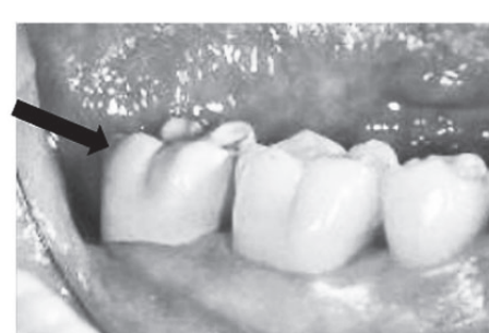
〈第二大臼歯に用いた例〉 11月22日中医協資料から