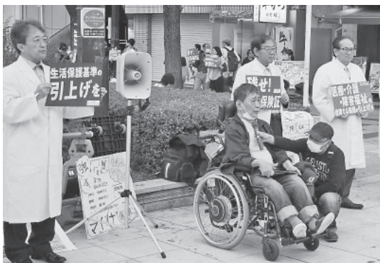
街頭で訴える集会参加者（中央）

「障害者権利条約」には、物価高のあたりで通院手控え 障害者の60%は年収200万円以下です。生活保護を受けている人も多く、障害者は通常の受給者の6倍です。物価高