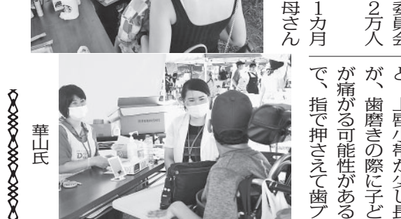
シが当たらないようにすることが