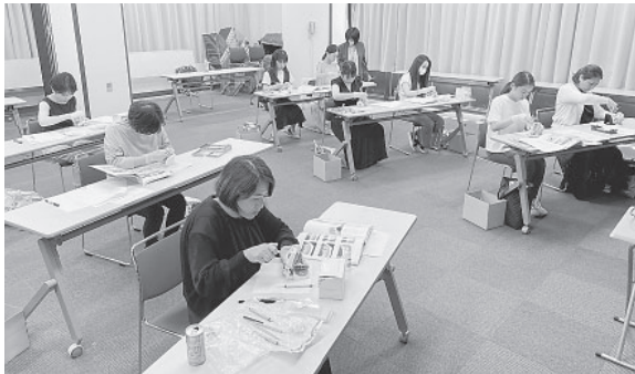
シャープニングセミナー開催