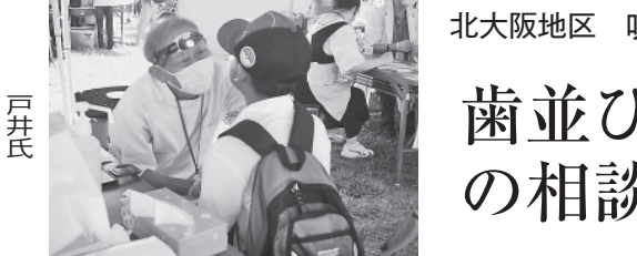
歯並び、矯正などの相談の声