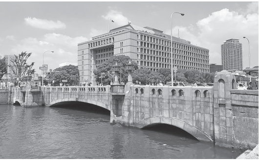
大谷龍雄のデザインによって造られた淀屋橋。鉄筋コンクリート造アーチ橋。橋梁設計の分野では珍しいデザインの一般公募で造られた

ちなみに、大阪には人 名のついた橋が多い。心 齋橋(岡田心齋)、太左 衛門橋(大坂太左衛 門)、末吉橋(末吉孫左 衛門)、佐野屋橋(佐野 屋弥平)など枚挙にいと まがない。