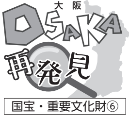
国宝・重要文化財⑥

土佐堀川に架かる淀屋 橋と堂島川に架かる大江 橋。この2つの橋が重要 文化財という、驚かれ る方も多いのではないだ ろうか。