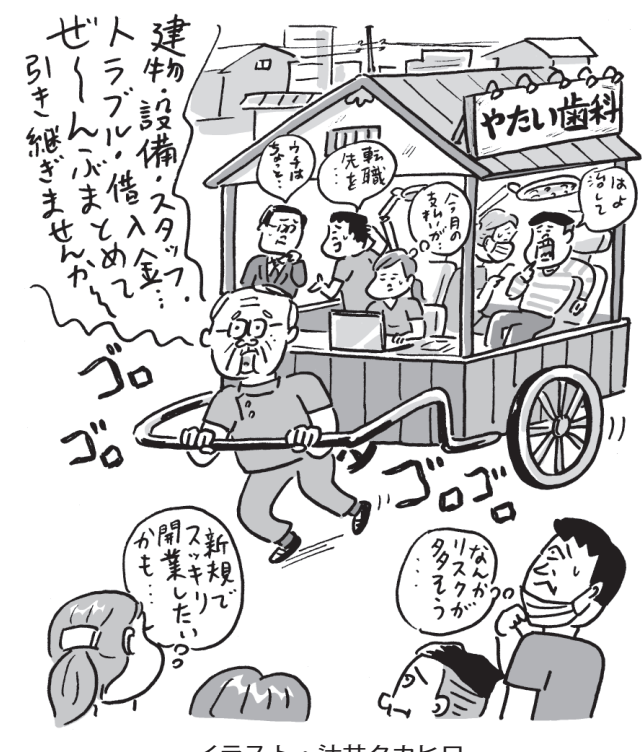
イラスト・辻井タカヒロ

医療法人(持分あり、なし)か、個人経営か... 解決しておきましょう。の課題やメリット・デメリットを、あなたにだけ助言する専門家を是非活用してください。(弁護士・楠晋一)