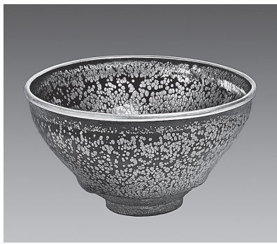
南宋時代・12~13世紀 高7.5cm、口径12.2cm、高台径4.2cm 大阪市立東洋陶磁美術館蔵 (住友グループ寄贈/安宅コレクション)