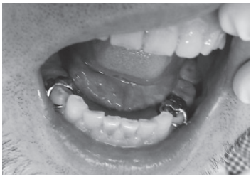
図2：上 鉤歯は歯冠長が短く、クラスプは腕が太い。下 左下6人工歯の近心に充填用光重合レジンを用いた調整法を薄く盛った。左下5FMCの遠心面と擦れたところが黒くなっている