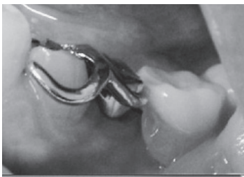
図2：上 鉤歯は歯冠長が短く、クラスプは腕が太い。下 左下6人工歯の近心に充填用光重合レジンを用いた調整法を薄く盛った。左下5FMCの遠心面と擦れたところが黒くなっている