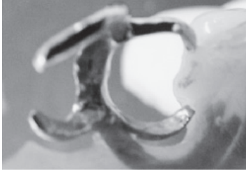
図2：上 鉤歯は歯冠長が短く、クラスプは腕が太い。下 左下6人工歯の近心に充填用光重合レジンを用いた調整法を薄く盛った。左下5FMCの遠心面と擦れたところが黒くなっている