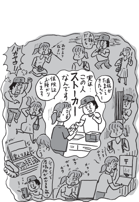
イラスト・辻井タカヒロ