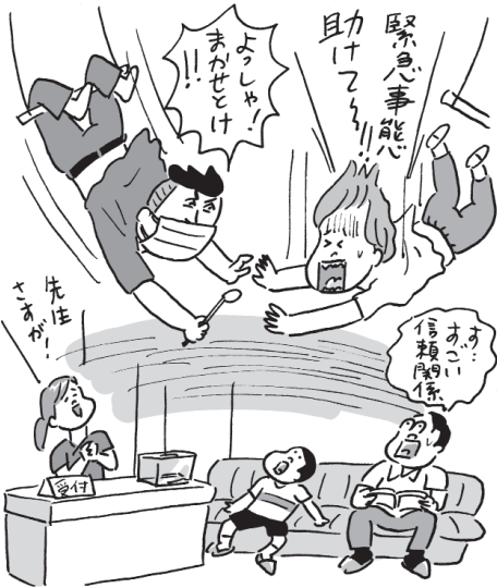
イラスト・辻井タカヒロ

このように応召義務は今日でも重要な公法上の義務ですが、他方で「信頼関係の喪失」と評価できる場合には、ある程度正当事由を柔軟に解する傾向にあるのも事実です。(弁護士・遠地靖志)